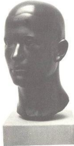
Ernst Suter Selbstbildnis, Bronze, 1924

Bildhauer, Keramiker und Plastiker. Kunst im öffentlichen Raum, Skulptur, Plastik, Relief, Medaillen, Keramik, Töpferei und Zeichnung.