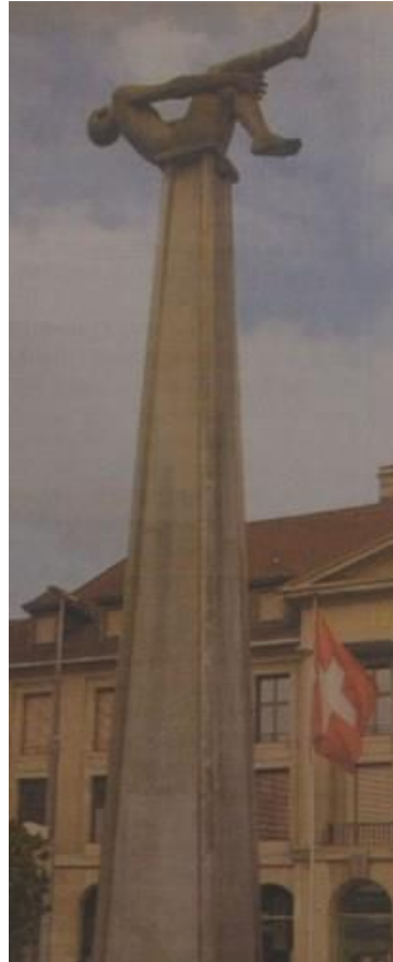
Der Träumer, Aarau, 1977