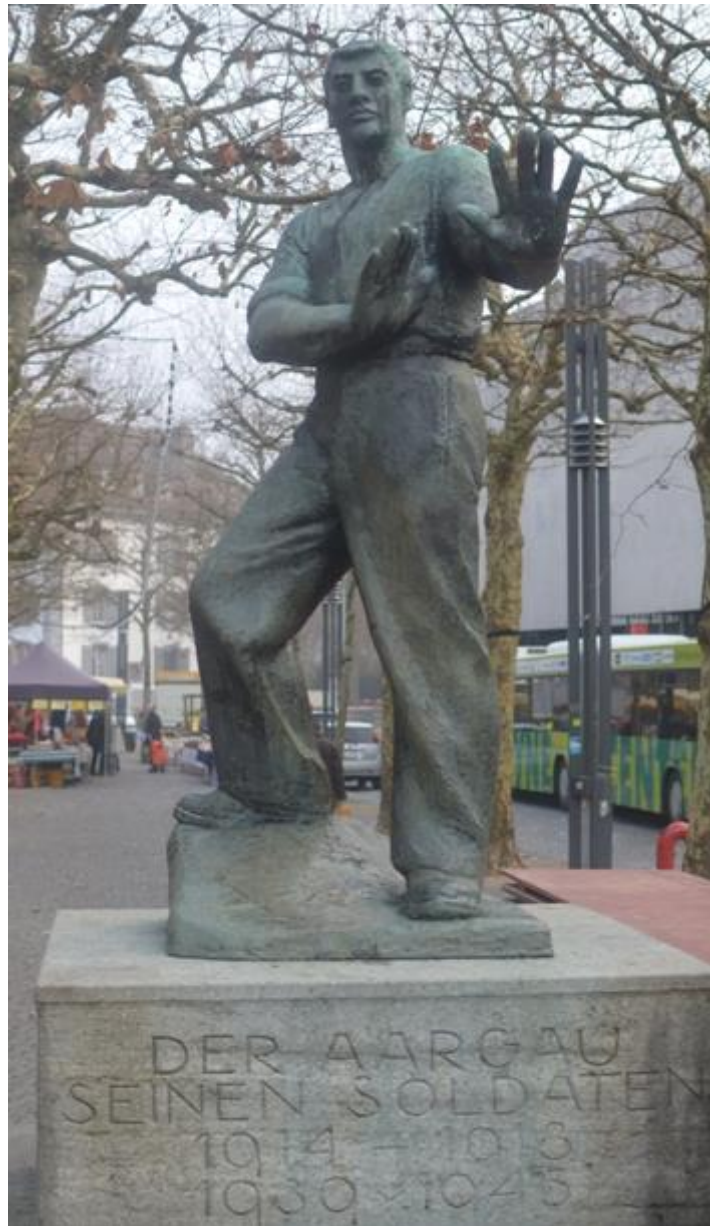
Wehrmännermal, Bronze, Aarau, 1949