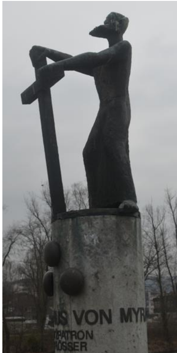
St. Nikolaus, Bronze, Brücke Döttingen, 1972

1952, Guggelbrunnen, Gönhardschulhaus Aarau, Bronze und Granit; 1954–1958, Hermann Obrecht-Denkmal, Grenchen, Granit, Höhe 6.18m; 1956, Meerjungfrau, Städtisches Rathaus Aarau, Solothurner Kalkstein; 1963 Relief, Aluminiumwerk Menziken, Aluminium; 1972, St. Nikolaus, Schutzpatron der Flösser, Döttingen, Bronze; 1977, Träumer, Aarau, Bronze; 1978, Verena-Figur, Rheinbrücke Bad Zuzach, Bronze; 1982, Kletterer, Aarau, Bronze.