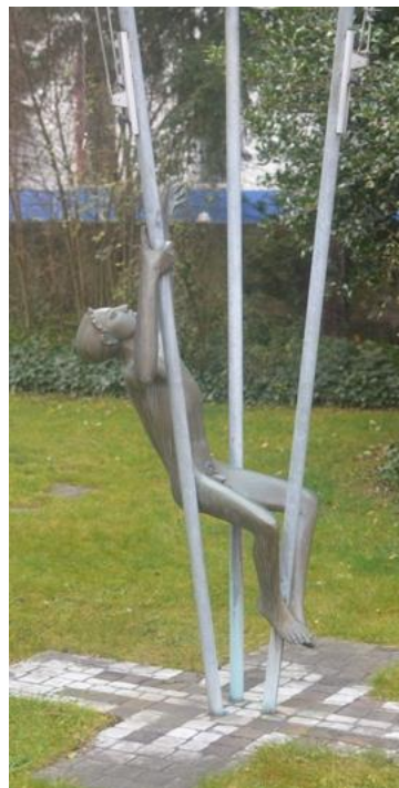
Kletterer, Bronze, 1982