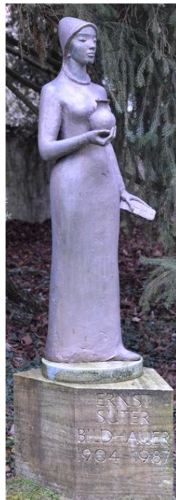
Grabmal Ernst Suter, Friedhof Aarau; die gleiche Figur steht als Verena in Zurzach (1978)