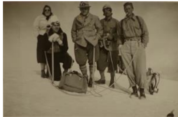
Auf dem Breithorn