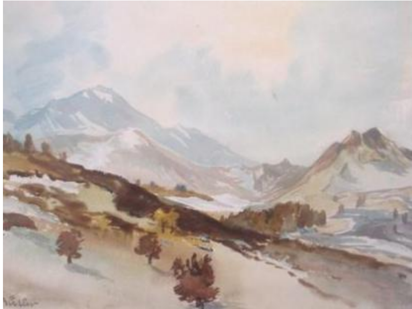
Im Frühjahr in den Bergen, Aquarell

Ansonsten bildete er sich autodidaktisch weiter. Einige Zeit war er als Bühnenbildner tätig gewesen. Gearbeitet hatte er in Bern, Luzern, Zürich und zuletzt in Basel, wo er als Malermeister selbständig ein eigenes Geschäft geführt hatte. Am liebsten beschäftigte er sich mit der Natur, dabei war ihm der Zauber der Bergwelt ein besonderes Anliegen.