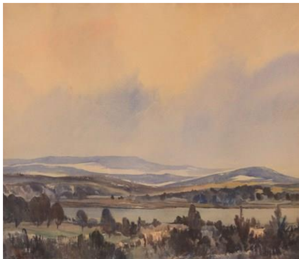
Voralpenlandschaft mit See, Aquarell