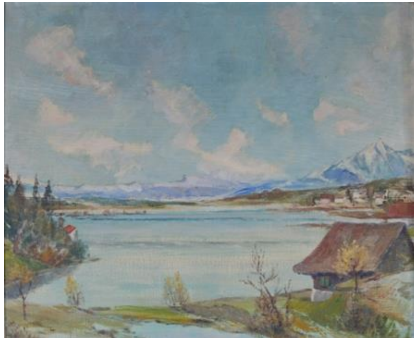
Hallwilersee mit Pilatus im Hintergrund, Öl

Mit wenigen Mitteln und auf einfache Weise gelang es ihm, das Bezeichnende eines Naturausschnitts herauszufühlen und wiederzugeben. Mit locker getupften Tönen verstand er es, das Typische des Juras und der Alpen festzuhalten.